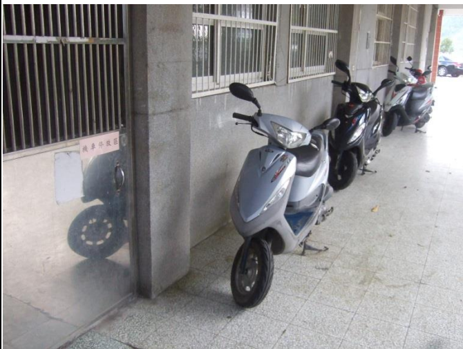
機車按指定位置停放