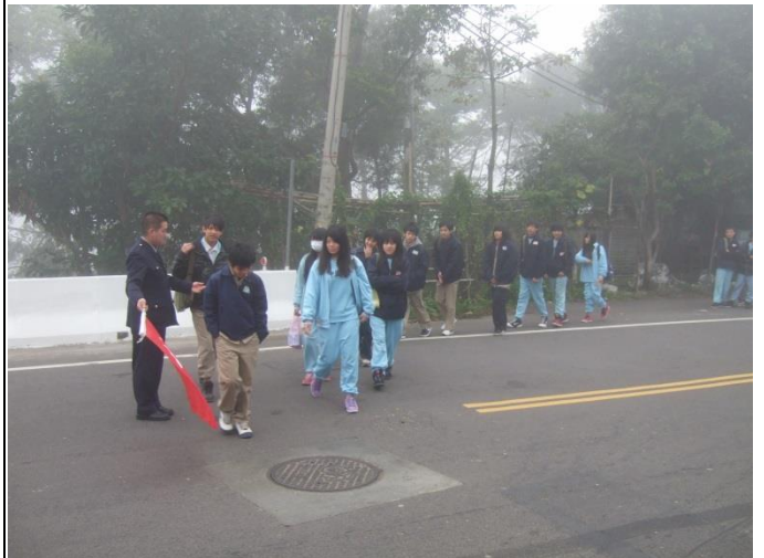
警衛進行交通安全維護工作