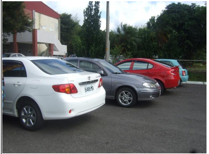
汽車按指定位置停放